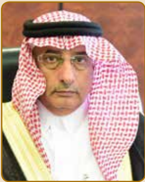
مدير الجامعة أ.د. فلاح بن فرج السبيعي